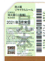
既販品用シール(見本)