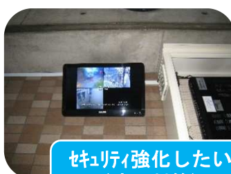
セキュリティ強化したい (防犯対策)