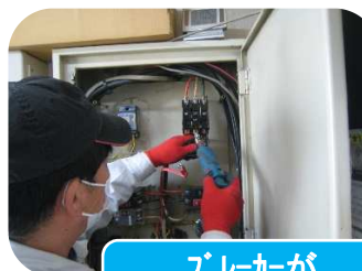
ブレーカーが よく落ちる