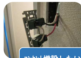
コンセント増設したい