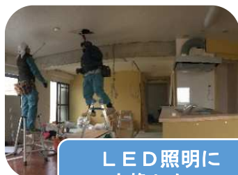
LED照明に 交換したい