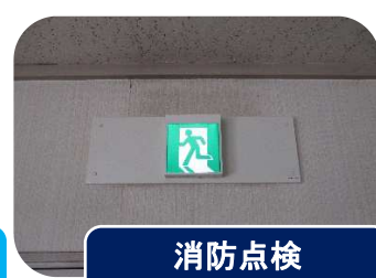
消防点検 (誘導灯交換等)