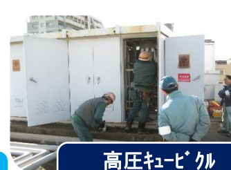
高圧キュービクル 改修