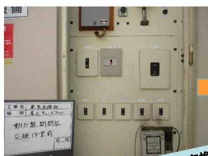
①No. 1 動力盤交換