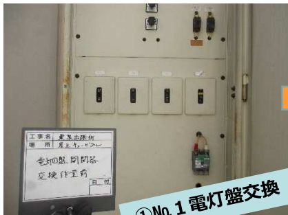
①No. 1 電灯盤交換