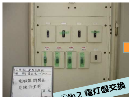
①No. 2 電灯盤交換